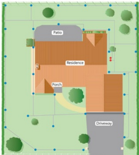
Jardin con MP Rotators