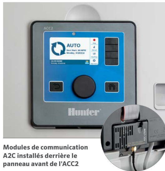
Modules de communication A2C installés derrière le panneau avant de l'ACC2