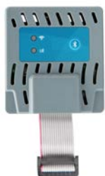
PC-WIFI Altezza: 11 cm Larghezza: 6 cm Profondità: 1,5 cm

Fornisce i programmatori Pro-C, ICC2 e ACC2 di una tecnologia di gestione di nuova generazione. Per ulteriori informazioni, visita centralus.hunterindustries.com .