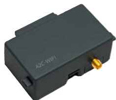
A2C-WIFI Altezza: 7,6 cm Larghezza: 5,7 cm Profondità: 2,5 cm