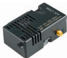
A2C-LTEM Altezza: 7,6 cm Larghezza: 5,7 cm Profondità: 2,5 cm