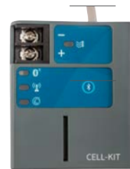
CELLKIT Altezza: 8 cm Larghezza: 6 cm Profondità: 4 cm