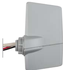
WIFIKIT Altezza: 10,8 cm Larghezza: 6,4 cm (installato) Profondità: 3,5 cm