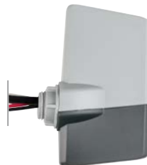
LANKIT Altezza: 10,8 cm Larghezza: 6,4 cm (installato) Profondità: 3,5 cm