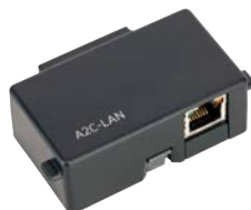
A2C-LAN Altezza: 7,6 cm Larghezza: 5,7 cm Profondità: 2,5 cm