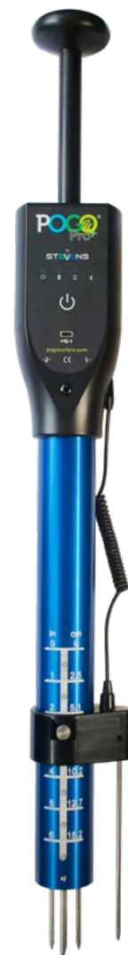
Sonda POGO Pro+

* W celu połączenia musisz mieć aktywne konto POGO TurfPro Cloud.