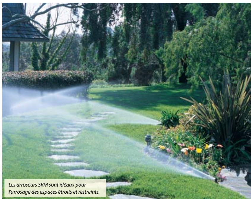
Les arroseurs SRM sont idéaux pour l'arrosage des espaces étroits et restreints.