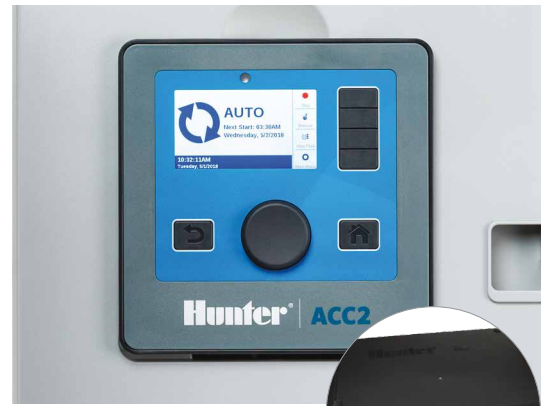
A2C-WIFI se instala detrás de la carátula del ACC2