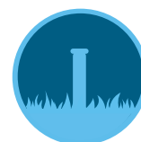
Eco-Indicator™ Strona 173