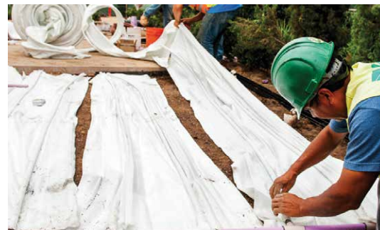
Nainštalovaná rohož Eco-Mat