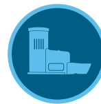
Rain-Clik esőérezékelő 144. oldal