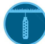
Soil-Clik Talajnedvesség érzékelő 151. oldal