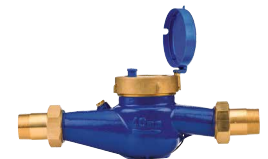
Medidor de caudal HC * Ver detalles en la página 140