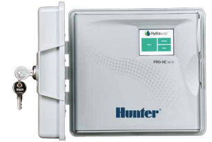
Pro-HC (plástico para exterior) Altura: 22,8 cm Ancho: 25 cm Profundidad: 10 cm