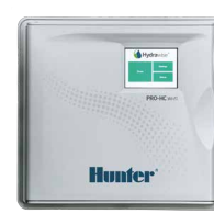
Pro-HC (plástico para interior) Altura: 21 cm Ancho: 24 cm Profundidad: 8,8 cm