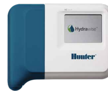
HC (plástico para interior) Altura: 15,2 cm Ancho: 17,8 cm Profundidad: 3,3 cm