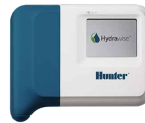
HC (interior de plástico) Altura: 15,2 cm Largura: 17,8 cm Profundidade: 3,3 cm