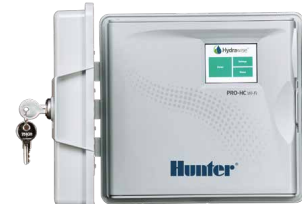
Pro-HC (exterior de plástico) Altura: 22,8 cm Largura: 25 cm Profundidade: 10 cm