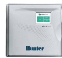
Pro-HC (interior de plástico) Altura: 21 cm Largura: 24 cm Profundidade: 8,8 cm