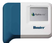
HC (пластмассовый для помещений) Высота: 15,2 см Ширина: 17,8 см Глубина: 3,3 см