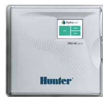
Pro-HC (пластмассовый для помещений) Высота: 21 см Ширина: 24 см Глубина: 8,8 см