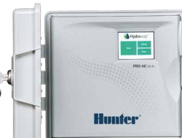
Pro-HC (пластмассовый для помещений) Высота: 22,8 см Ширина: 25 см Глубина: 10 см