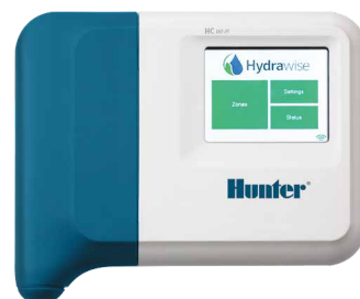
HC (plastový vnútorný model) Výška: 15,2 cm Šírka: 17,8 cm Hĺbka: 3,3 cm