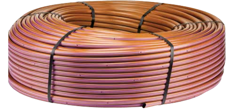
HDL-R (Arıtılmış su)

Arıtılmış su kaynakları için isteğe bağlı renk opsiyonu (yalnızca 17 mm'lik için mevcuttur).