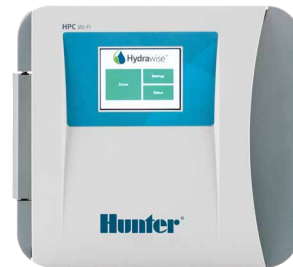
HPC cserélhető előlap