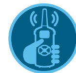
ROAM távvezérlő 137. oldal ROAM XL távvezérlő 138. oldal