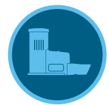
Rain-Clik esőérzékelő 144. oldal