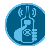
Telecomando ROAM Pagina 137 Telecomando ROAM XL Pagina 138