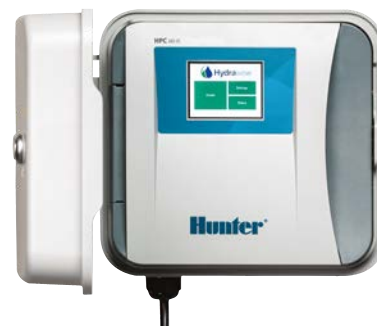
HPC (per interni/esterni, in plastica) Altezza: 22,9 cm Larghezza: 25,4 cm Profondità: 11,4 cm