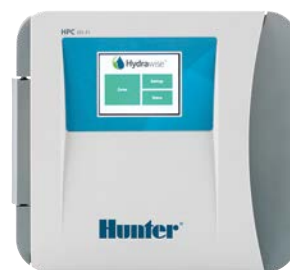
Pannello frontale HPC