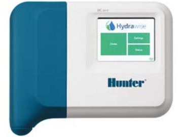
وحدة تحكم HC عدد 6 و 12 محطة