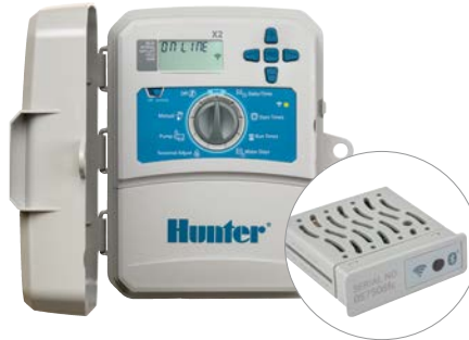
وحدة تحكم X2 مع وحدة WAND عدد 4 و 6 و 8 و 14 محطة