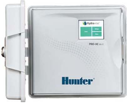
وحدة التحكم Pro-HC عدد 6 و 12 و 24 محطة