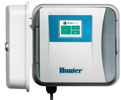
HPC-Steuergerät Stationsanzahl 4 bis 16