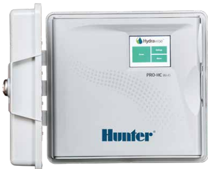
Pro-HC Steuergerät Stationsanzahl 6, 12 und 24