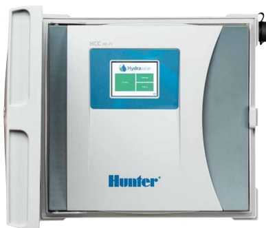
Programador HCC De 8 a 54 estaciones, con opción de EZDS de dos hilos