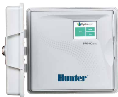
Programmatore Pro-HC 6, 12 e 24 stazioni