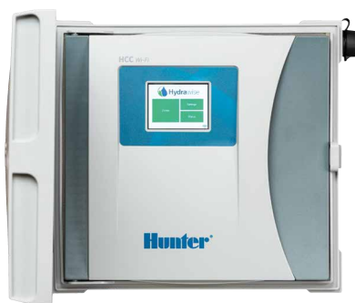
Programmatore HCC da 8 a 54 stazioni, opzione EZDS a monocolore