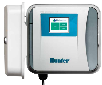
Programmatore HPC da 4 a 16 stazioni