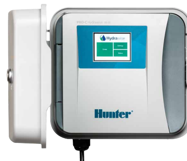
Sterownik HPC Liczba sekcji: od 4 do 16