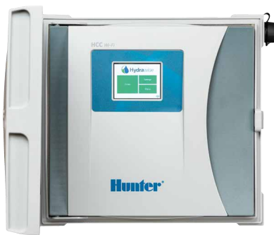
Riadiaca jednotka HCC 8 až 54 sekcií, podpora dvoch vodičov EZDS