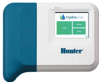
Riadiaca jednotka HC 6 a 12 sekcií

Považuje sa za spoľahlivý nástroj na úsporu vody