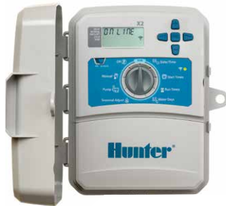
Riadiaca jednotka X2 s modulom WAND 4, 6, 8 a 14 sekcií