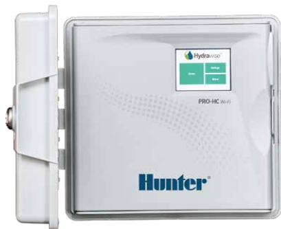
Riadiaca jednotka Pro-HC 6, 12 a 24 sekcií