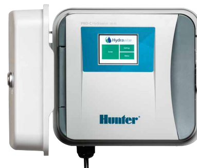
Riadiaca jednotka HPC 4 až 16 sekcií