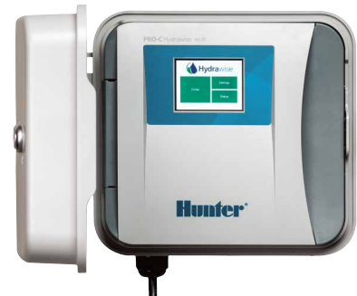
Pro-C Hydrowise Steuergerät Steuergerät mit 4 - 16 Stationen