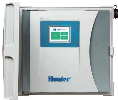
HCC Steuergerät Steuergerät mit 8 - 54 Stationen