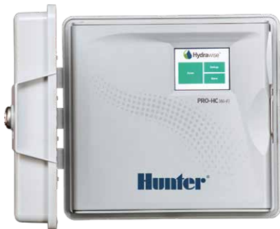
Pro-HC Steuergerät Steuergerät mit 6, 12 und 24 Stationen