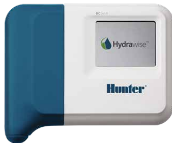
HC-Steuergerät Kompatibel mit Steuergeräten mit 6 und 12 Stationen