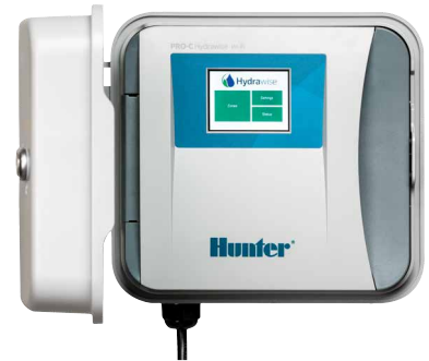
Pro-C Hydrowise Controller Programador de 4 a 16 estaciones