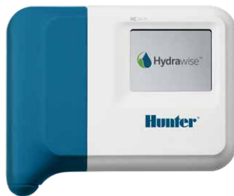
Programador HC Programador de 6 estaciones fijas o modular de 12 a 36