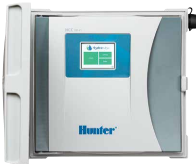
HCC Controller Programador de 8 a 54 estaciones