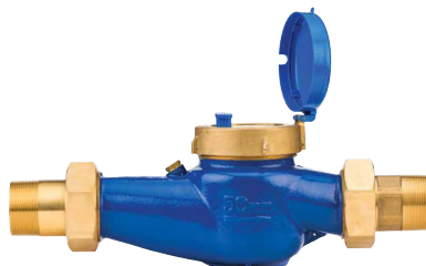
Caudalímetro Añada un medidor de caudal opcional para recibir alertas de caudal y supervisar el uso de agua