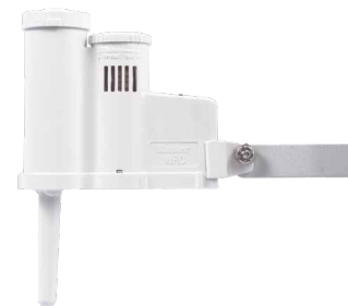
Rain-Clik Mejore el consumo de agua gracias a su función de interrupción del riego