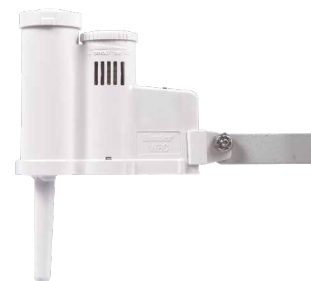
Rain-Clik Ottimizzate il consumo dell'acqua con lo spegnimento sul luogo