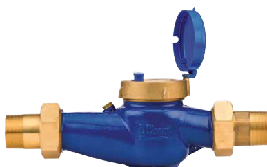
Misuratore di portata Aggiungete un misuratore di portata opzionale per avvisi sul flusso e monitorare il consumo d'acqua