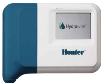
Programmatore HC Programmatore a 6 e 12 stazioni compatibile