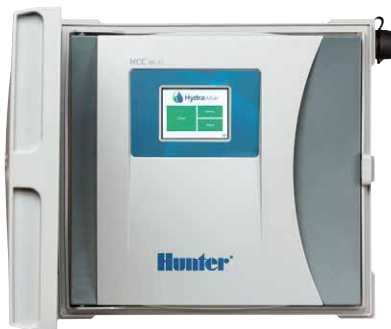
Programmatore HCC Programmatore a 8-54 stazioni