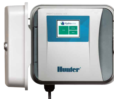
Programmatore Pro-C Hydrowise Programmatore 4-16 stazioni