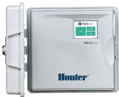
Programmatore Pro-HC Programmatore a 6, 12 e 24 stazioni

Provateci oggi stesso con una dimostrazione gratuita disponibile su hydrawise.com/demo