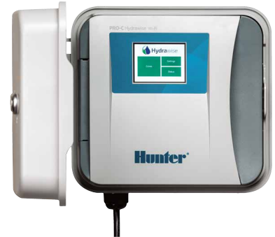
Controlador Pro-C Hydrowise Controlador de 4-16 setores