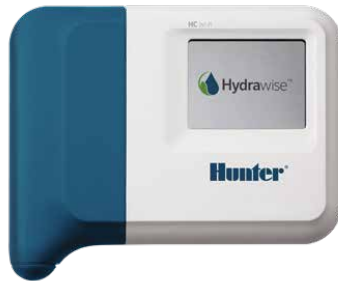
Controlador HC Controlador de 6 e 12 setores