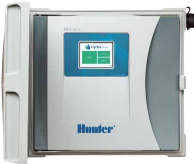
Controlador HCC Controlador de 8-54 setores