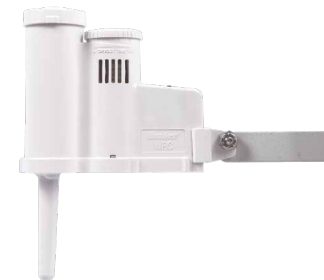
Rain-Clik® Melhore o consumo de água com o desligamento da irrigação no caso de chuva