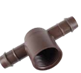
PLD-075-TB-TEE موصل حرف تي بارب 17 مم x سن 3/4 بوصة