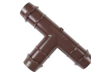
PLD-TEE موصل حرف تي بارب 17 مم