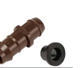
PLD-IAC (باستخدام حلقة تثبيت) قم بتركيب المحول x وصلة توصيل 17 مم