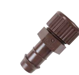
PLD-CAP بارب 17 مم x MPT بقطر 1/2 بوصة مع غطاء