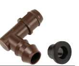
PLD-IAE (باستخدام حلقة تثبيت) قم بتركيب المحول x كوع 17 مم