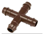
PLD-CRS موصل بارب رباعي 17 مم