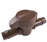
PLD-BV محبس غلق بارب 17 مم