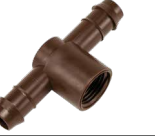
PLD-050-TB-TEE FPT بقطر 1/2 بوصة x وصلة حرف تي بارب 17 مم