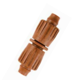
PLD-LOC CPL وصلة قفل سريعة التوصيل