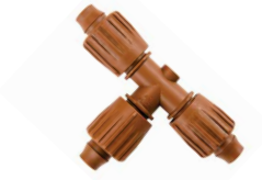
PLD-LOC TEE موصل قفل على شكل حرف تي