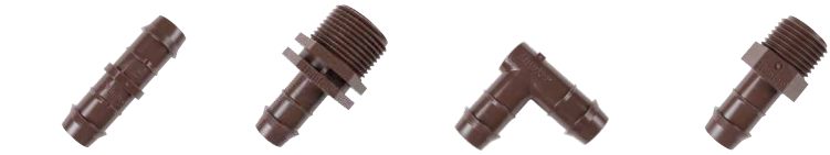
PLD-CPL وصلة توصيل سريعة بارب 17 مم