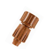
PLD-LOC FHS محور خرطوم أنثى بقطر 3/4 بوصة x LOC