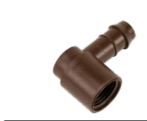
PLD-075-TB-ELB FPT بقطر 3/4 بوصة x كوع بمسكة شوكية 17 مم