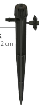
SD-B-STK Altezza: 15,2 cm