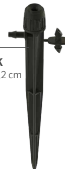
HS-B-STK Altezza: 15,2 cm