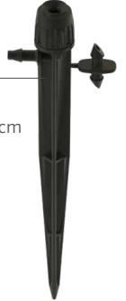
HS-B-STK Altura: 15,2 cm