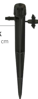
SD-B-STK Výška: 15,2 cm