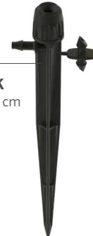
HS-B-STK Výška: 15,2 cm