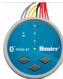
NODE-BT Durchmesser: 8,9 cm Höhe: 8,3 cm

Die Bluetooth® Wortmarke und Bluetooth® Logos sind registrierte Marken der Bluetooth SIG, Inc. iOS ist eine Marke oder registrierte Marke von Cisco Systems Inc. in den USA und weiteren Ländern. Android ist eine Marke der Google LLC. Die Nutzung dieser Marken durch Hunter Industries ist durch Lizenz gestattet.