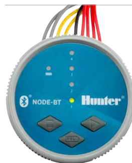
NODE-BT Diamètre : 8,9 cm Hauteur : 8,3 cm

La marque et les logos Bluetooth® sont des marques déposées détenues par Bluetooth SIG, Inc., et toute utilisation de ces marques par Hunter Industries est effectuée sous licence. iOS est une marque de commerce ou une marque déposée de Cisco aux États-Unis et dans d'autres pays, et elle est utilisée sous licence. Android est une marque de commerce de Google LLC.