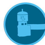
Sonde Mini-Clik Page 145