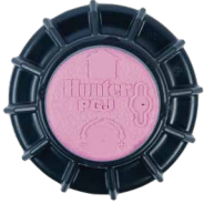
PGJ Artılmış Su Ayırt Etme Kapağı

Tüm modellerde fabrikada montajlı bir opsiyon olarak bulunur