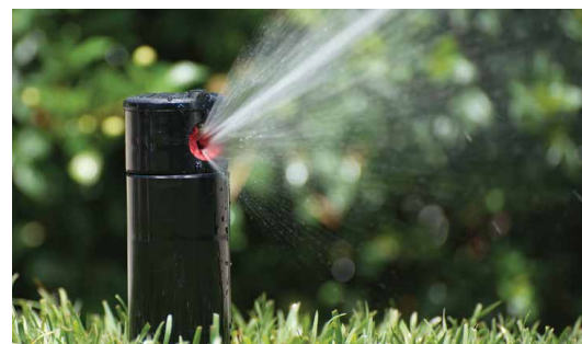
Červená tryska PGP

PGP-ADJ -07 = 10 cm výsuv, nastaviteľná výšeč a červená tryska č. 7