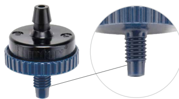
② 10-32 Gewinde