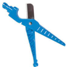
Hunter Emitter-Multitool P/N HEMT (Zum Lochen, Einsetzen und Ausbauen von Emittlern und zum Schneiden von Rohren)