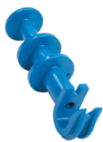
Lochstanzer P/N POCKETPUNCH (Zum Stanzen, Einsetzen und Ausbauen von Emittlern)