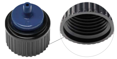
③ ½" Innengewinde