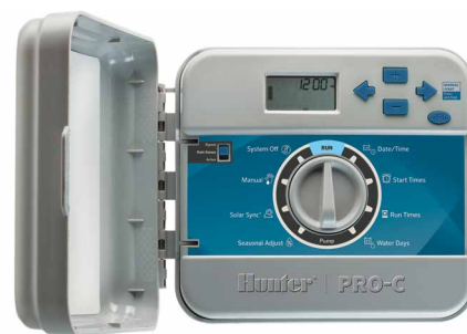
Plastový vnútorný model

Výška: 22,9 cm Šírka: 25,4 cm Hĺbka: 11,4 cm