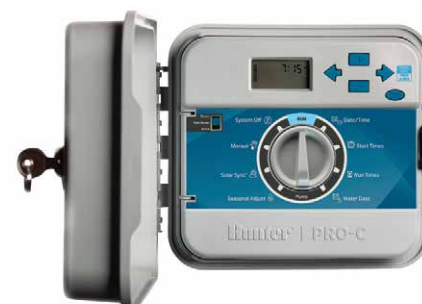
Plastový vonkajší model

Výška: 22,9 cm Šírka: 25,4 cm Hĺbka: 11,4 cm