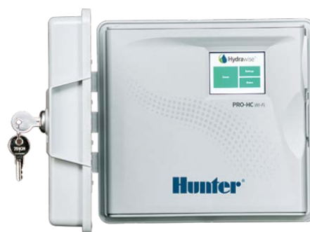
Pro-HC (in plastica, per esterni) Altezza: 22,8 cm Larghezza: 25 cm Profondità: 10 cm