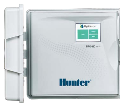
Pro-HC (in plastica, per interni) Altezza: 21 cm Larghezza: 24 cm Profondità: 8,8 cm