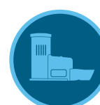
Sensore Rain-Click Pagina 144