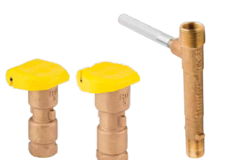
HQ-3RC HQ-5RC HK-33

HQ5-LRC-BSP = zawór HQ5 z gumową osłoną z zatrzaskami i gwintami BSP