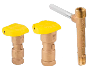
HQ-3RC HQ-5RC HK-33

HQ5-LRC-BSP = válvula HQ5 com tampa de borracha com trava e roscas BSP