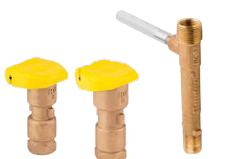
HQ-3RC HQ-5RC HK-33

HQ5-LRC-BSP = Ventil HQ5 s uzamykateľným gumeným krytom a BSP závitom