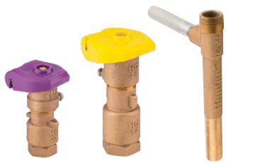
HQ-33DLRC HQ-44LRC HK-44