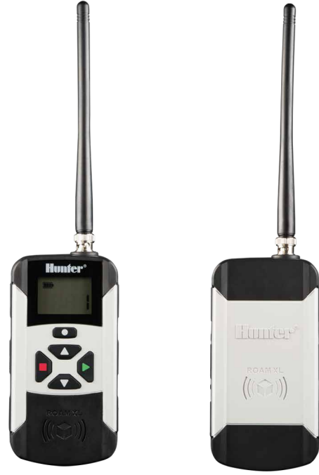
ROAM XL (anten olmadan) Yükseklik: 16 cm Genişlik: 8 cm Derinlik: 3 cm