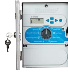
Paslanmaz Çelik Yükseklik: 25 cm Genişlik: 19 cm Derinlik: 11 cm