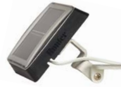
SPXCH Güneş Paneli Kiti (isteğe bağlı) Yükseklik: 8 cm Uzunluk: 25 cm Genişlik: 8 cm