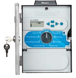
Paslanmaz Çelik Solar Panel Yükseklik: 27 cm Genişlik: 19 cm Derinlik: 11 cm