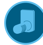
Freeze-Clik (Don) Sensörü