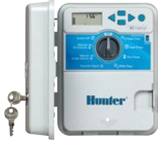
Plastik Yükseklik: 22 cm Genişlik: 18 cm Derinlik: 10 cm