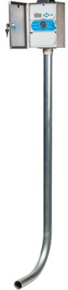
XCHSPOLE Direk montaj kiti (isteğe bağlı) Yükseklik: 1,2 m