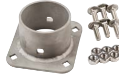
XCHSPB Yalnızca montaj aparatı ve donanım (opsiyonel)