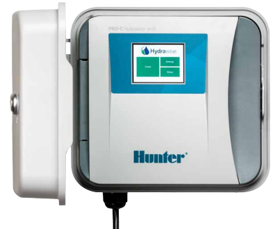
Контроллер Pro-C Hydrowise контроллер на 4-16 станций