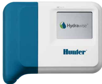
Контроллер HC Совместимый 6- и 12-станционный контроллер