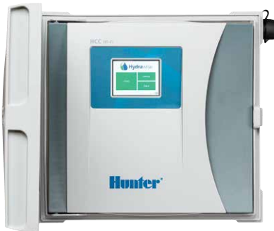
Контроллер HCC контроллер на 8-54 станций