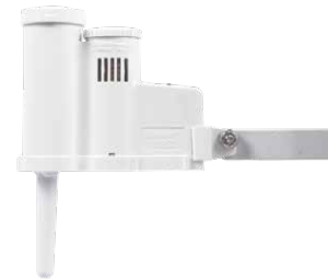
Rain-Clik® Рационализируйте расход воды с отключением на объекте