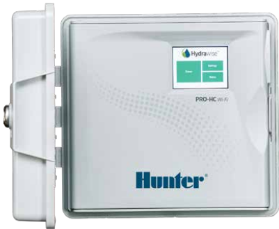
Контроллер Pro-HC 6-, 12- и 24-станционный контроллер