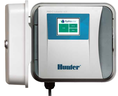
Pro-C Hydrowise Kontrol Ünitesi 4-16 istasyonlu kontrol ünitesi