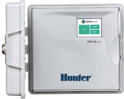
Pro-HC Kontrol Ünitesi 6, 12 ve 24 istasyonlu kontrol ünitesi

hydrawise.com/demo sayfasındaki ücretsiz tanıtım videosunu izleyin ve řimdi deneyin