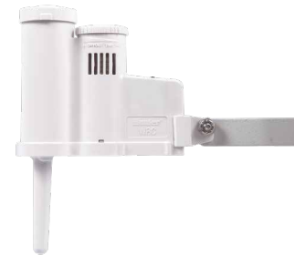
Rain-Clik® Sahada kapatma özelliđiyle su tasarrufu sađlayın