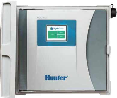
HCC Kontrol Ünitesi 8-54 istasyonlu kontrol ünitesi