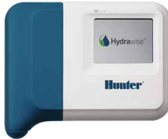
HC Kontrol Ünitesi Uyumlu 6 ve 12 istasyonlu kontrol ünitesi