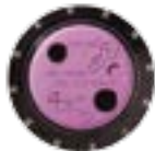
I-40 Eaux Usées

▶ = Descriptions détaillées des caractéristiques à la page 20