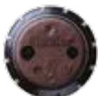
I-40 haute vitesse

Disponible comme option montée en usine sur tous les modèles