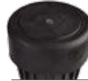
Kauçuk kapak kitleri I90-ADV: P/N 234200 I90-36V: P/N 234201