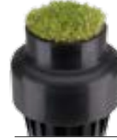
Çim kabı kiti P/N 467955

▶ = Gelişmiş Özellik ayrıntılı açıklamaları, sayfa 20