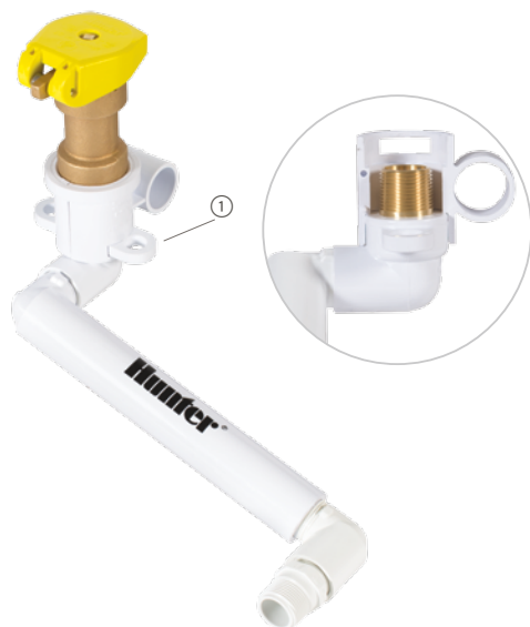
① HQ5LRC Schnellkupplung mit SnapLok ausgestattetem HSJ-1 Drehgelenkanschluss

Die neue Hunter Produktlinie der HSJ Drehgelenkanschlüsse für harte Beanspruchung bietet Konfigurationen für jeden Bedarf und jedes Projekt, einschließlich eines einzigartigen, speziell für Schnellkupplungsanwendungen entwickelten Modells. Wählt man den SnapLok-Auslass für HSJ-1 Modelle, so verfügt der Drehgelenkanschluss über Hochleistungsauslassgewinde aus Messing und kann zusätzlich als Bewehrungsstab und zur Leitungstabilisierung verwendet werden. Für Schnellkupplungsinstallationen in Hunter-Qualität ist ein SnapLok-Auslass empfehlenswert.