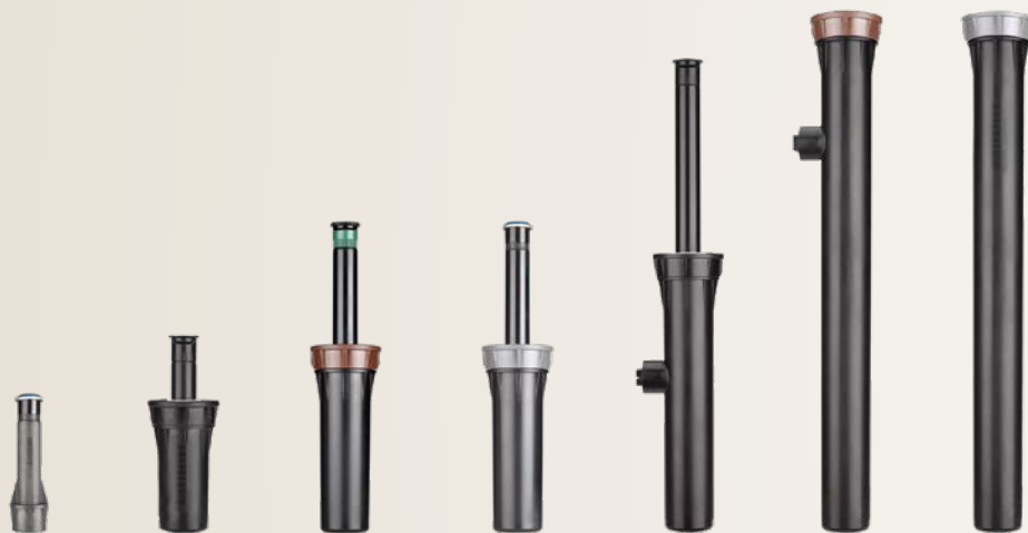
Nelle immagini riportate sopra: PRS40 per arbusti, Pro-Spray 2", PRS30 e PRS40 4", Pro-Spray 6" e irrigatori PRS30 e PRS40 da 12"

Tutti i modelli sono inoltre dotati di un coperchio di spurgo con anello di tenuta per evitare residui e ostruzioni. Inoltre, l'irrigatore Hunter Pro-Spray è compatibile con tutti gli ugelli femmina standard del settore, offrendo un elevato livello di flessibilità.