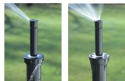
Soluzione della concorrenza

Il traffico pedonale, le macchine per la manutenzione dei terreni, le variazioni di temperatura e i cambi di pressione ciclici spesso causano l'allentamento dei coperchi del corpo. La maggior parte degli statici utilizza un O-ring, che causa la rottura immediata della guarnizione dopo l'allentamento. Pro-Spray è in grado di sopportare più giri a 360° rimanendo sigillato a qualsiasi pressione.