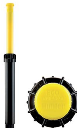
ECO-ID 缩回高度：24 cm 弹出高度：15 cm 暴露直径：3 cm 进口尺寸： \frac{1}{2} "