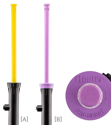
[A] ECO-ID-12 [B] ECO-ID-12-R 缩回高度：41 cm 弹出高度：30 cm 暴露直径：5.7 cm 入口尺寸： \frac{1}{2} "