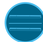
HDL 与 PLD 滴灌管