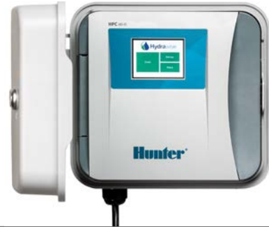
HPC (塑料室内型/室外型) 高：22.9 cm 宽：25.4 cm 厚：11.4 cm

立即试用 Hydrawise 软件，无需硬件，访问 hydrawise.com 即可